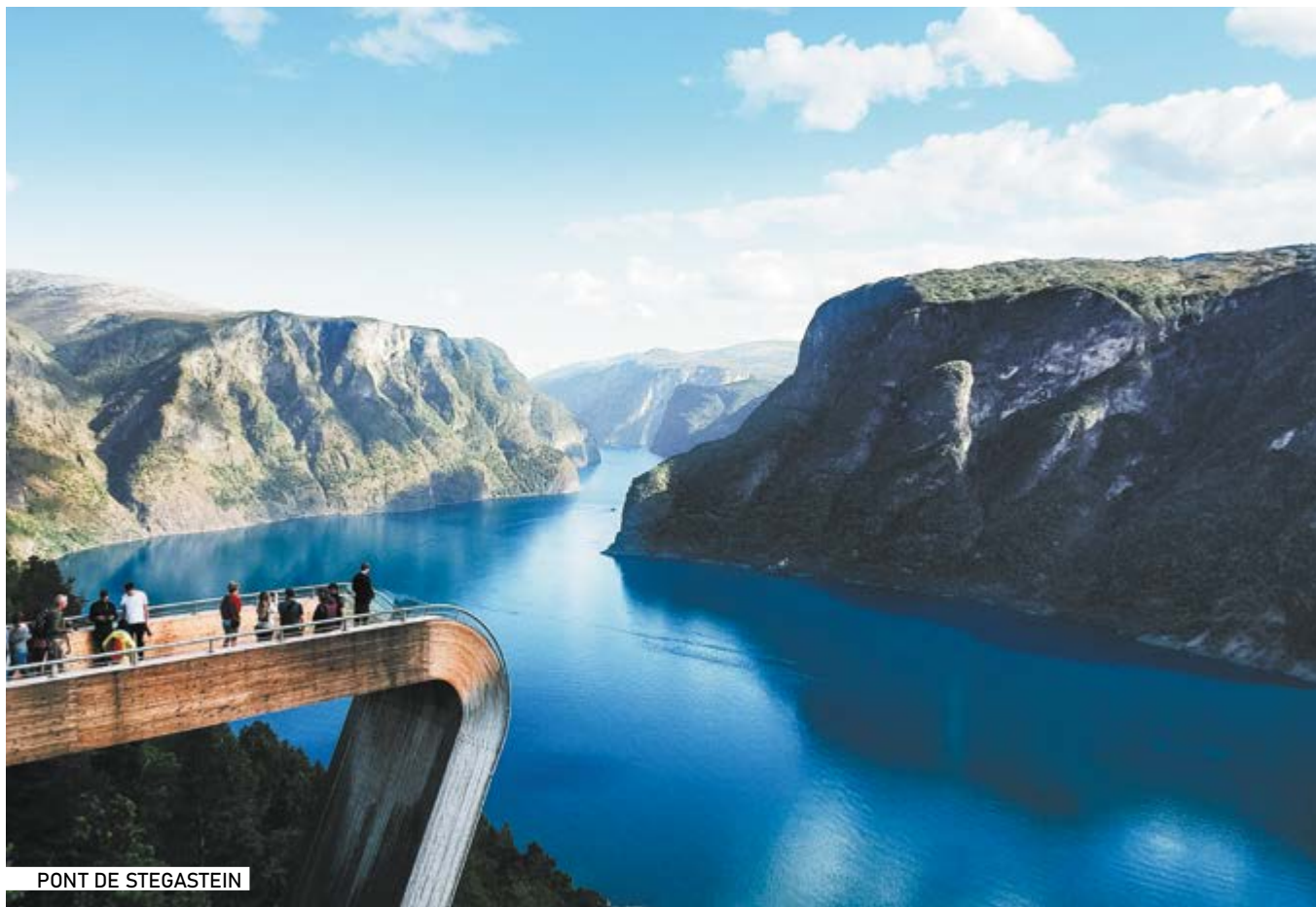
PONT DE STEGASTEIN