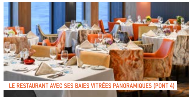
LE RESTAURANT AVEC SES BAIES VITRÉES PANORAMIQUES (PONT 4)