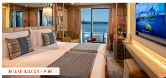
DELUXE BALCON - PONT 5